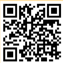
พ.ร.บ. ช้างเผือก ฯ